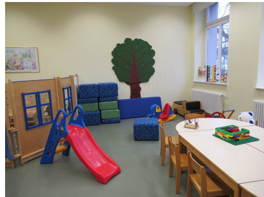
Das Spielzimmer im Mehrgenerationenhaus